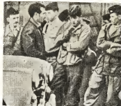
E trinos in Argelia ta aumentando